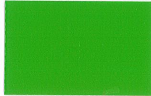
T-10 ライトグリーン [透光率:1.6%]