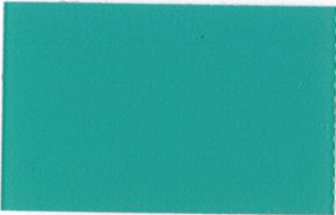
T-04 エメラルドグリーン [透光率:0.2%]