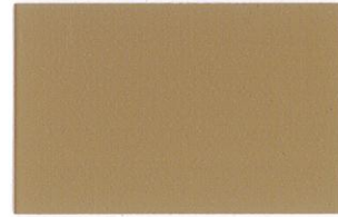
T-51 ライトブラウン [透光率:0.1%]