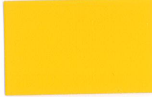
T-11 イエロー [透光率:5.9%]