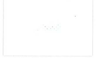
T-18 ホワイト [透光率:4.9%]