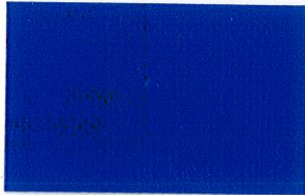
T-01 ロイヤルブルー [透光率:0%]