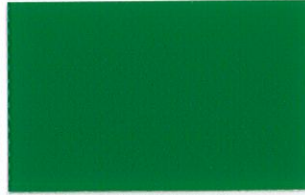
T-09 フォレストグリーン [透光率:0.2%]