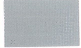
T-19 グレー [透光率:0.4%]