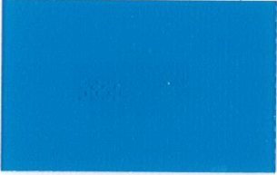
T-02 ライトブルー [透光率:0.1%]