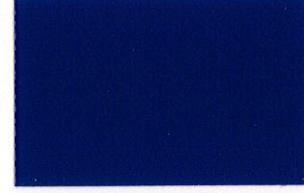
T-50 ダークパープル [透光率:0%]