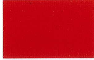
T-13 レッド [透光率:0.7%]