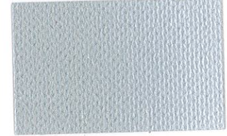
T-21 シルバー [透光率:0%]